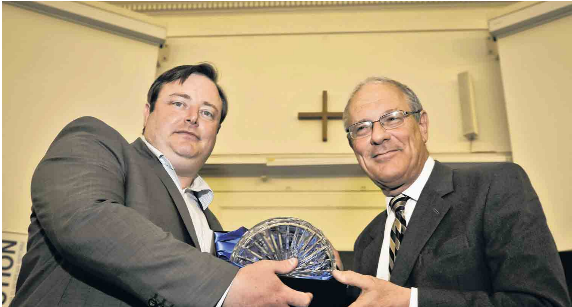
Een prikkelende gedachte van Dalrymple zette De Wever op weg om zelf columnist te worden.

THEODORE DALRYMPLE KRIJGT PRIJS VAN DE VRIJHEID